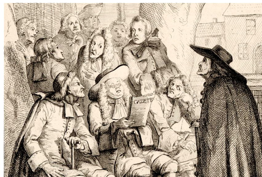
« Des nouvellistes dans un jardin écoutent la lecture d'une gazette », gravure, XVIII e siècle